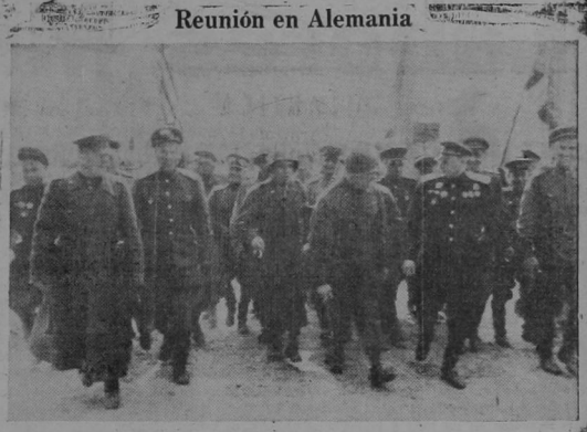
Reunión en Alemania

Y aquí surge otra vez el contraste. Se crea un impuesto para el desarrollo de la cultura física, como factor esencial de la salud individual, y carecemos de agua, que tiene que ser mucho más importante para la salud pública. De poco habrá de servirnos el desarrollo de los músculos y el lujo de los eventos deportivos, si los servicios higiénicos de las casas están prácticamente inservibles, si el baño diario resulta un lujo que sólo pueden darse los ricos y si las cloacas de las calles despiden olores que no resultan de ámbar.